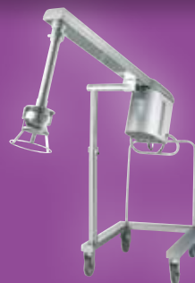
TURBO-STANDMIXER TBX 120/130