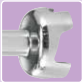
Lager, Messer und Schaft aus Edelstahl