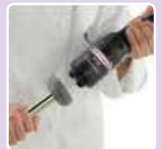
Ohne Werkzeug auseinander zu nehmen