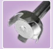
Optionaler Emulsionsstab für das Emulgieren ohne Luft in die Masse einzuschließen